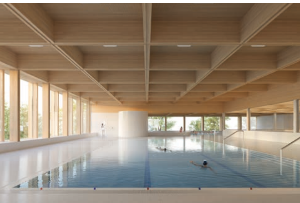
Die Visualisierung zeigt das Lehrschwimmbekken des neuen Hallenbads. Im Hintergrund ist der Planschbereich zu sehen. Die Fenster zeigen auf das Freibad Weyermannshaus hinaus.

Das Freibad bleibt während der Bauarbeiten geöffnet.